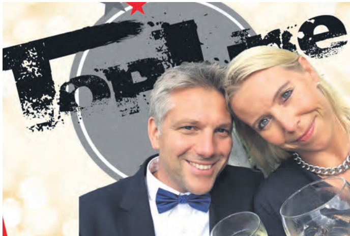
Für beste Musik wird durch die Gruppe „Top Line“ gesorgt sein.

Das Handwerkerfest oder Handwerkerball, hat in Hanerau-Hademarschen bereits eine jahrzehntelange Tradition. Doch während viele traditionelle Veranstaltungen gerne Gefahr laufen über die Jahre hinweg an Reiz zu verlieren, gelingt es dem Verein für Handel, Handwerk und Gewerbe immer wieder neuen, frischen Wind in die unterschiedlichsten Events zu bringen. So dürfen sich diejenigen, die sich Karten für den 25. Januar