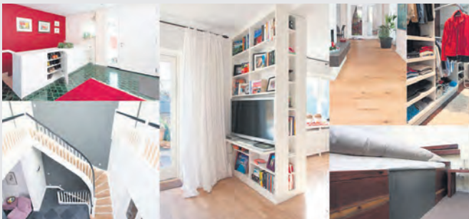
Individueller Möbelbau in klassischer - oder moderner Gestaltung wird zunehmend von anspruchsvollen Kunden gewünscht.

"Wir garantieren ein Maximum an Qualität, anspruchsvolles Design und Preiswürdigkeit. Fairen Umgang miteinander sowie eine sorgfältige und gewissenhafte Bearbeitung sichern wir Ihnen heute schon zu."